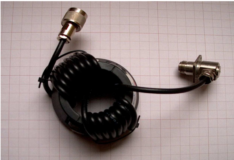
Rdzeń z monitora CRT - kabel RG58 2 x 8zw